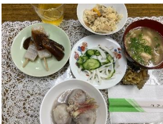
10月23日 誕生日会メニュー