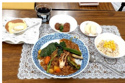
9月18日 誕生日会メニュー

夏野菜トッピング カレー・甘酢肉団 子・ツナとコーン サラダ・梨・ロー ルケーキ