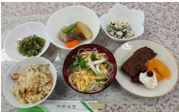
7月24日誕生日会 メニュー