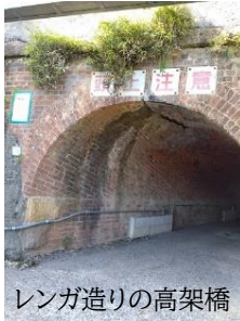
レンガ造りの高架橋

高槻を通り京都方面に西国街道と並んでJR 東海道線がほぼ並行して走っています。私は西国街道近くの山手町に住んでいます。そこから西国街道を少し京都よりに行くと高槻市萩之庄地域になります。そこにはJR 東海道線の明治時代約百年前にレンガで造られた高架橋があります。百年以上経っているのに崩れなく今も現役で働いています。この煉瓦造りは上下でなく、少し斜めになっていますが、この施工の方法が強固で長持ちするためにこの造りになったそうです。さらに進んでいくと上牧の手前に古くからある一里塚があります。今はそこにお堂が建てられています。