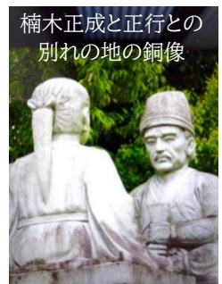
楠木正成と正行との別れの地の銅像