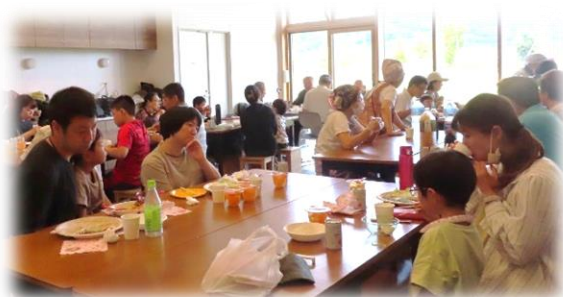
ランチ会での楽しいひと時

ナルク子ども食堂のイベント式での『日曜日のランチ会』は、徐々に定着してきました。今年度の子ども食堂は、2023年度『24時間テレビチャリティー事務局』からの『キッチンボード』の提供を受け、ほぼ備品も揃いました。次の課題は来年6年目に向けての新規スタッフの参加とリーダーの育成です。『子ども食堂』が高槻・島本の地域貢献活動として継続する事は大事です。