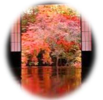
岩倉実相院・床モミジ