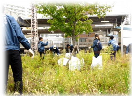
前年度クリーンアップ風景