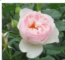
イングリッシュ・ヘリテージ