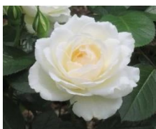
プリンセス・ウェールズダイアナ