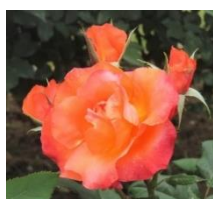
プリンセス・ミチコ