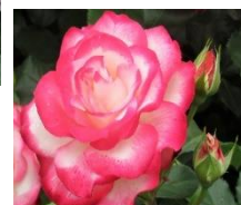
プリンセス・モナコ