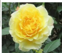
フランス・アンフォ